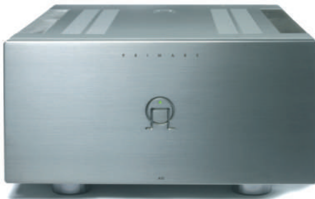
Il nuovo finale Primare A32 è un grande monolite dall'estetica sobria ed elegante. Le sue performance sono di tutto rilievo, essendo esso capace di ben 250W per canale su 8 ohm. Disponibile in nero o in finitura titanio, è un amplificatore a carattere definitivo.

Le grandi peculiarità delle elettroniche Primare, nelle quali prevale la musicalità e l'eufonicità vengono assolutamente garantite in questa accoppiata. Ciò che di solito si teme, soprattutto in presenza di finali molto potenti, è infatti una perdita a volte marcata di dolcezza nell'emissione; tale perdita è in qualche modo compensata dalla grande forza dell'amplificatore, ma è raro riuscire a trovare un "grande finale", una macchina, cioè, capace di coniugare muscoli e dolcezza. L'A32 è in grado di fare questo, essendo un apparecchio dolce, sornione, con eccellenti capacità analitiche e dotato "anche" di una potenza e una capacità di pilotaggio che lasciano attoniti. Veloce, perentorio, di grande spessore musicale, riesce nei macro-contrasti come nei micro-contrasti a essere rispettoso di ogni nuances musicale. Parliamo dell'A32 ma vogliamo lasciare ampio spazio anche al PRE30, senza dubbio già noto, ma che probabilmente non tutti conoscono. In abbinamento con questo A32, ma non di meno con l'A30.2 suo degno "compare" già da diverso tempo, il PRE30 è sempre stato apprezzato come un apparecchio dall'incredibile rapporto qualità/prezzo, e tant'è. In abbinamento all'A32, esso riesce ad essere ancora più convincente, grazie alla grana sottile di cui è capace, al suo saper essere introspettivo ma non eccessivamente "esotico".