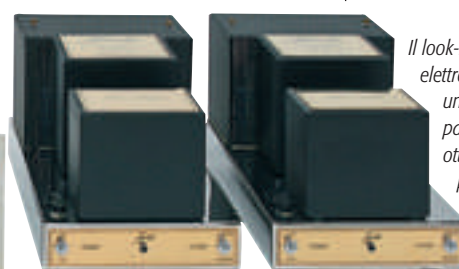
Il look-feeling retrò di tutte le elettroniche Jadis è davvero unico e inconfondibile. I pannelli frontali sono in ottone, come le manopole del preamplificatore JPS-8, tornite dal pieno.