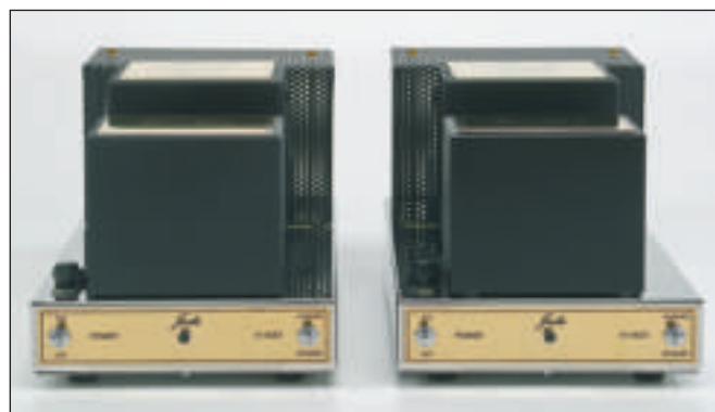
Il pannello frontale del JA-50 è estremamente semplice, ed è realizzato con una targa in ottone massiccio lucidato a mano. Notare i trasformatori di alimentazione e uscita, che è poco definire surdimensionati.

Si chiamano JPS-8 e JA-50 e sono, rispettivamente, un preamplificatore a 2 telai e due finali monofonici da 40W, e offrono il classico, splendido, look-feeling di casa Jadis. Il JPS-8 è un preamplificatore solo linea bilanciato, occupa il secondo gradino tra i preamplificatori a 2 telai Jadis, ed è preceduto dal JP-30MC, un pre sbilanciato con alimentazione a stato solido e dotato di ingresso phono MC, non presente in questo JPS-8 e per avere il quale è necessario acquistare un pre-pre a parte (per esempio il JPP-200 o il JPS-3 sempre di Jadis). Dicevamo due telai, uno di alimentazione, a valvole