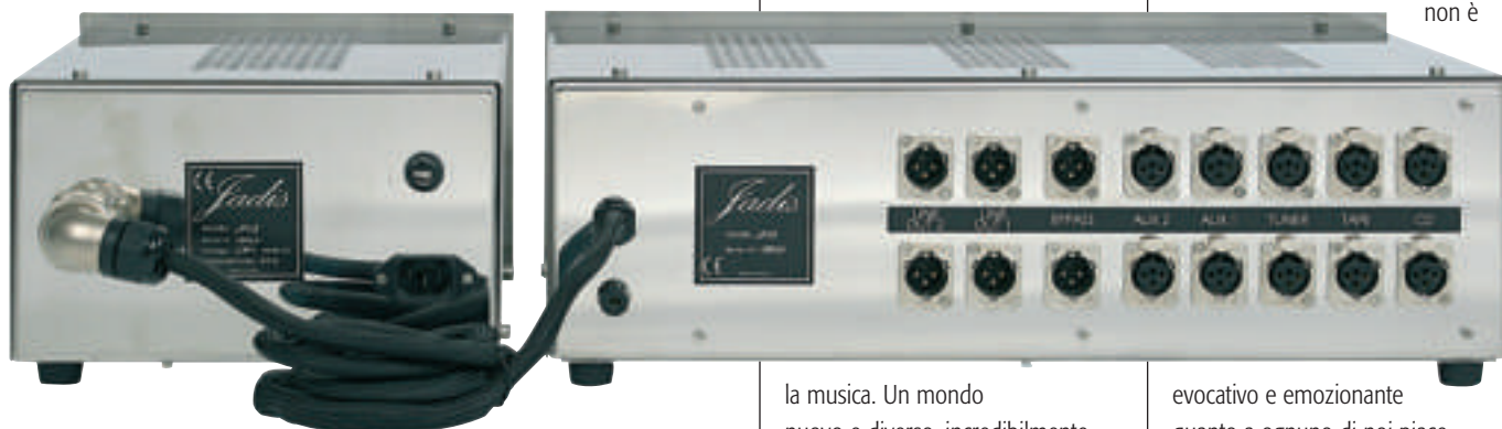
Il JPS-8 è un preamplificatore totalmente bilanciato, e pertanto si interfaccierà in maniera ottimale con le numerose sorgenti bilanciate rintracciabili in commercio. Notare il cavo di tipo professionale che collega il preamplificatore vero e proprio con la sua unità di alimentazione.