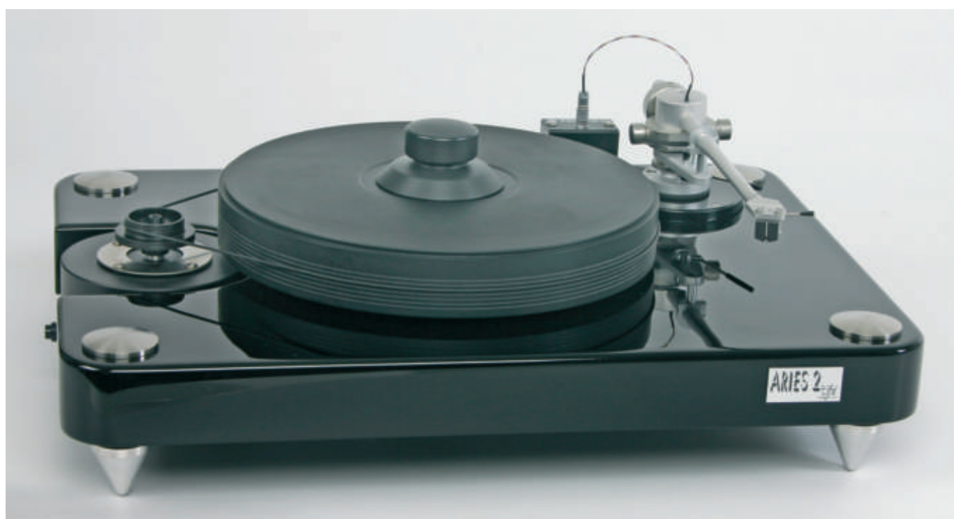
L'Aries Black Knight è un giradischi su base rigida con motore alloggiato in un contenitore esterno. I robusti piedini in acciaio permettono il massimo isolamento dalle vibrazioni esterne.