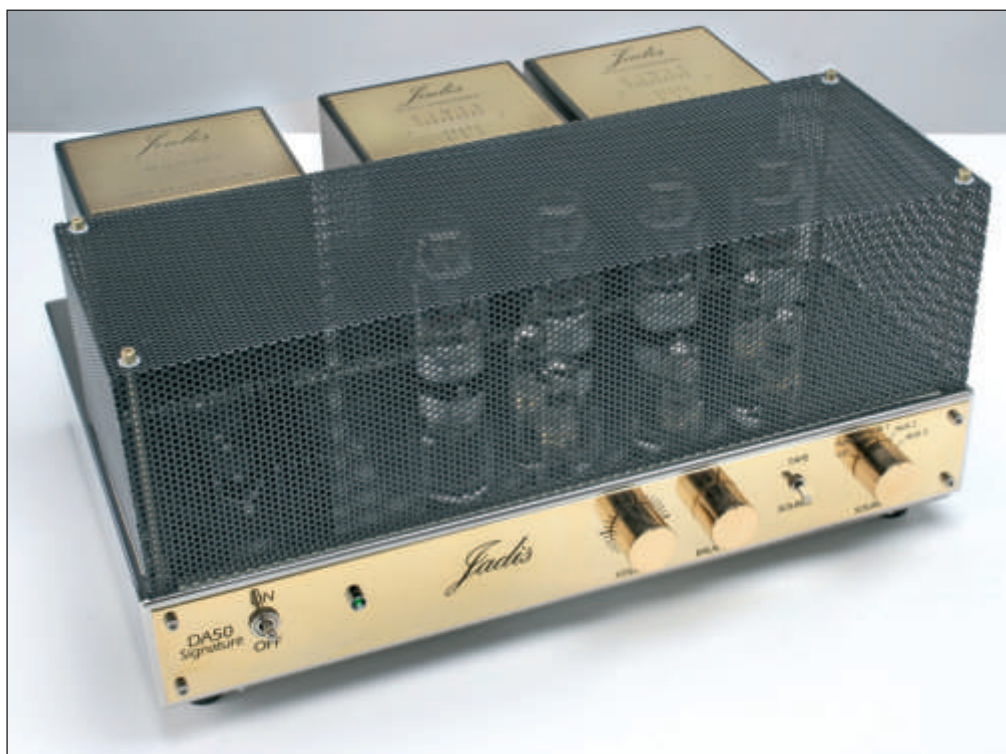
Una griglia nera finemente forata può essere montata a protezione dei tubi. Tale struttura non impoverisce lo splendido impatto estetico, e permette di vedere le valvole mentre funzionano salvaguardando l'incolumità dei preziosi tubi.

interruttori sono grandi e facilmente impugnabili, con la caratteristica di ricalcare il tipico disegno vintage del costruttore. All'interno, il cablaggio in aria è davvero ben eseguito e ordinato; vengono sfruttati molti conduttori in rame di ampio diametro ai quali sono poi appoggiati i fili più sottili. Solo a ridosso del pannello posteriore, è presente un circuito stampato dove sono montati i pin di ingresso e il selettore a cui è assicurato un lungo rimando che porta fino alla manopola sul frontale. Molto comodi e ben dimensionati, i morsetti di uscita per i diffusori sono duplicati per supportare senza problemi il bi-wiring. Il tutto è, quindi, anche molto razionale e improntato all'ottimizzazione dei percorsi al fine di evitare ogni possibile interazione o lungo tragitto. Le valvole montate sono ben 9, 4 di potenza (le famose KT88) e 5 - tutte ECC82 - per preamplificare il segnale. Una volta sballato l'amplificatore, è necessario sistemare le valvole negli