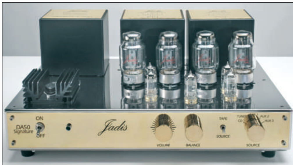
Il mobile che contiene il DA50 Signature è molto elegante e realizzato con materiali di grande livello. I comandi sono quelli essenziali, e oltre al controllo del volume e bilanciamento, è presente solo la manopola di selezione degli ingressi e gli interruttori tape-monitor e power.

Tutti gli apparecchi che escono dalla catena produttiva di Jadis sono costruiti a mano da personale specializzato. Il cablaggio, poi, è quasi sempre (a meno di rari casi) effettuato in aria e ciò vuol dire, per i meno tecnici, che all'interno dei Jadis esiste un ordinatissimo insieme di cavi in grado di collegare tutti gli elementi tra di loro e non un circuito stampato, come invece avviene per la stragrande maggioranza degli altri. Questo migliora notevolmente l'isolamento tra i vari componenti ma il cablaggio in aria, ampiamente utilizzato fino alla fine degli anni '60, è stato successivamente abbandonato per la maggiore complessità che richiede, soprattutto in presenza di circuitazioni più articolate come lo sono quelle a stato solido (transistor).