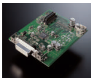
Il circuito di interfaccia DVI è alloggiato sopra a quello video, ed è equipaggiato con chipset SiliconGraphics. Nel DVD A11 le scelte sono state fatte tenendo conto prima della qualità intrinseca di ogni elemento e poi dei costi.

Svideo duplicate, come duplicate sono anche le SCART che a richiesta possono emettere segnale RGB o Svideo. Sono presenti, inoltre, in/out IEEE1394 (comunemente conosciuta come firewire) che saranno utili qualora si debba connettere il DVD-A11 ad un decoder esterno, o si voglia decodificare uno stream esterno con il DVD-A11; stessa funzione ha l'uscita DENON LINK, la quale permette la veicolazione bidirezionale del segnale digitale da decodificare. La presenza di firewire e denonlink sono indispensabili se pensiamo alla larghezza di banda necessaria ai nuovi formati per essere trasmessi. Se per il Dolby Digital, e il DTS (comprese tutte le varianti di entrambi), infatti, è sufficiente un semplice collegamento in fibra o in coassiale, con i nuovi standard multiformato SACD e DVD-Audio quei collegamenti non sono più sufficienti; si è reso pertanto necessario trovare un nuovo modo di trattare il segnale digitale a banda larga, ed ecco la ragione per cui si è adottata la IEEE1394, standard riconosciuto a livello mondiale, e la DENON LINK II, proprietaria, ma facente le stesse funzioni della firewire. Continuiamo la carrellata connettiva, che vede le "tradizionali"