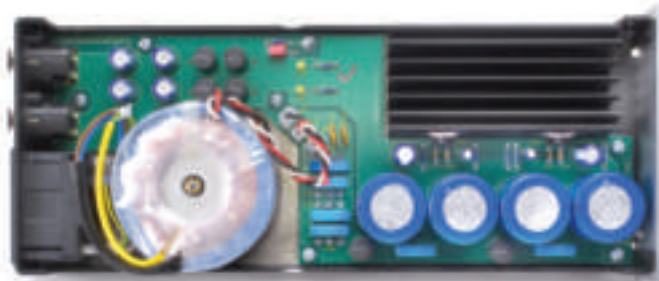
L'alimentatore è dotato di un toroidale di grande capacità e da sezioni di livellamento e prima stabilizzazione che è riduttivo definire surdimensionate.

Il braccio è un classico moderno di Pro-Ject Audio, il modello in fibra di carbonio 10CC, con errore radiale minimizzato in virtù della sua lunghezza extra, articolazione su cuscinetti, contrappeso a gravità. Circa i fonorivelatori, ci siamo tolti lo sfizio di provarne ben tre: Sumiko Blue Point Special Evo III, Sumiko Black Bird, Denon DL103R, tutti di tipo MC, i Sumiko ad alta uscita (2.5mV), il Denon solo 0.25mV.