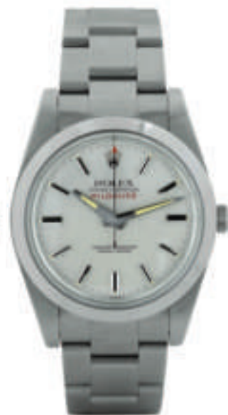
La Ref. 1019 del Milgauss (nella foto un modello del 1970) rimase in vendita fino al 1988. Il design è simile -seppure con le dovuta differenziazioni- alla attuale Ref. 116400 e la sua quotazione, vista la maggiore reperibilità sul mercato, può raggiungere i 30.000 euro.

quanto potesse esserlo nel 1954, considerato che al giorno d'oggi l'esposizione ai campi magnetici è sicuramente triplicata, a causa del