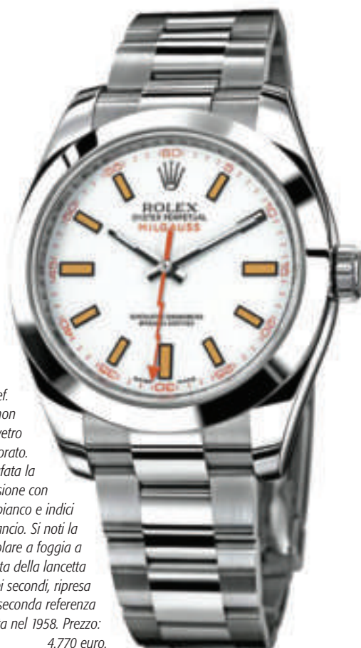
La Ref. 116400 non adotta il vetro zaffiro colorato. Qui fotografata la versione con quadrante bianco e indici arancio. Si noti la particolare a foglia a saetta della lancetta centrale dei secondi, ripresa dalla seconda referenza prodotta nel 1958. Prezzo: 4.770 euro.