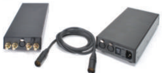
Il collegamento tra alimentatore e pre è costituito da un ottimo cavo con connettori DIN di tipo professionale a 4 poli.