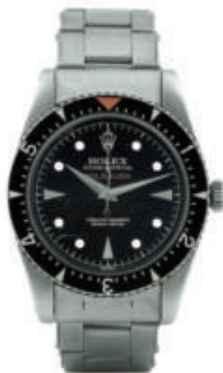
Il primo modello realizzato del Milgauss, la Ref. 6541 (nella foto un esemplare del 1958), con la cassa tipo Submariner e il quadrante a nido d'ape. La sua valutazione oggi può anche raggiungere i 70.000 euro.

è sempre di colore arancio. Passando ad analizzarne il cuore, il nuovo calibro automatico 3131 presenta interessanti soluzioni tecniche con lo scopo di migliorarne la resistenza ai campi magnetici, come l'ancora della scappamento realizzata in un nuovo materiale amagnetico. Inalterata, invece, rispetto ai suoi predecessori, la collaudata costruzione del secondo fondello in ferro dolce, composto da due sezioni avvitate all'interno della cassa. Insomma, i nostalgici di questo singolare modello sono stati accontenti da questa rentrée in grande stile, decisamente più attuale ora per la sua peculiarità di