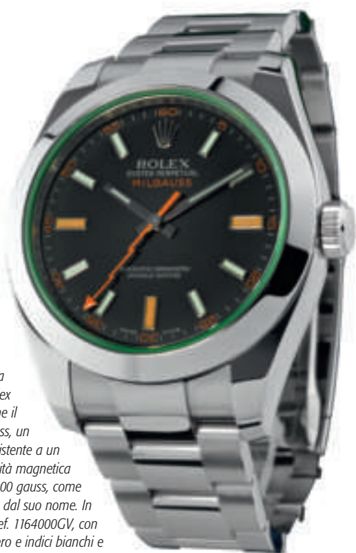
A distanza di cinquant'anni dalla sua nascita la Rolex ripropone il Milgauss, un orologio resistente a un flusso di densità magnetica fino a 1.000 gauss, come sottolineato dal suo nome. In foto la Ref. 116400GV, con quadrante nero e indici bianchi e arancio, e con il vetro zaffiro verde. Prezzo: 5.065 euro.

progresso scientifico e tecnologico. Siamo sicuri, perciò, che la nuova produzione avrà decisamente un destino e una fortuna migliori.