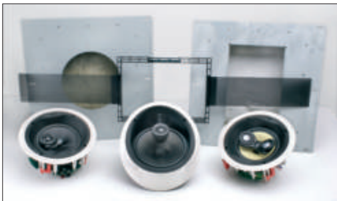
La produzione InWall di B&W è anche ricca di box da incasso e di pre-mount kit. Da sinistra: il box da incasso BB C6, adatto per molti dei modelli circolari, il rettangolare PMK 650, pre-mount kit per CWM 650, e infine il BB W6, adatto al CWM 6160.

5cm in Kevlar e un woofer da 17,5cm sempre in Kevlar, esso rappresenta il top assoluto in soluzioni Home Cinema invisibili all'occhio, ma eccezionalmente "udibili" ad orecchio.