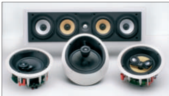
La gamma InWall di B&W è davvero ampia. Dietro il CWM LCR8, un diffusore adatto sia per la diffusione dei canali principali L e R che per centrale. A sinistra il CCM 618, un coassiale con tweeter orientabile dalle ottime prestazioni e al centro, una delle chicche della produzione B&W InWall. Parliamo del CCM 817, che utilizza la tecnologia Nautilus e adotta per il filtro crossover delle capacità Mundorf ad alte prestazioni. A destra, infine, il CCM 746s, stereofonico con doppio tweeter orientabile e woofer a due bobine.