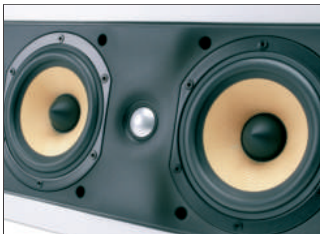
Nel CWM LCR8 il tweeter a cupola da 2,5 cm in tecnologia Nautilus è leggermente caricato a tromba, per aumentarne l'efficienza e per evitare il più possibile indesiderate riflessioni sulle pareti vicine.

provisto di condotto posteriore, il CCM817 monta un woofer da 17,5cm in Kevlar di ultima generazione. Molte nuove alternative anche per i diffusori da incasso a sviluppo orizzontale o verticale. Si parte dagli economici CWM6160 e CWM6260, entrambi con woofer in fibra di